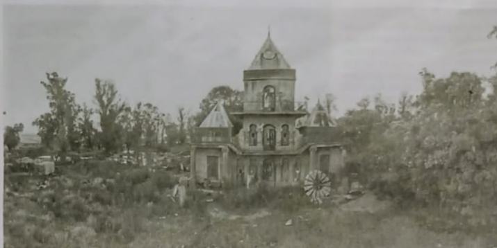
El Castillo Zubiaurre, proyecto frustrado por un amor no correspondido