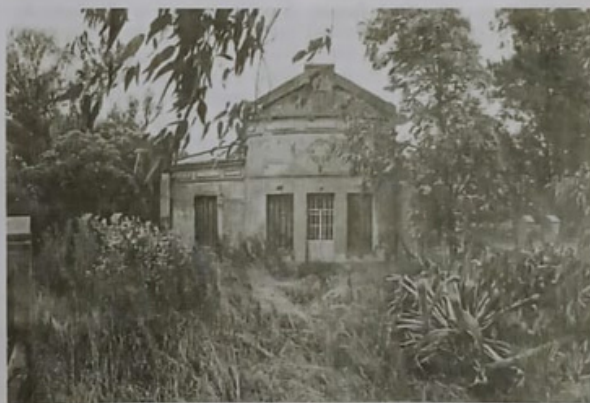
La Martina, una de las casas visitadas por el fotógrafo

rie, en 2017, ya había aprendido a abrirse caminos: nacido en Buenos Aires en 1977, estudió arte en Boston entre los veinte y los treinta años. Expuso en varios países y representó a la Argentina en una muestra curada por Alfons Hug en el Instituto Italo Latinoamericano (IILA) durante la Bial de Venecia de 2013. En 2015 la editorial Prestel publicó el libro Stories , con la serie iniciada una década antes sobre la transformación de la vida rural