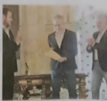
Santa Cruz, en la Legislatura

Edición de hoy a cargo de Natalia Blanc www.lanacion.com/cultura | @LNcultura | Facebook.com/lanacion cultura@lanacion.com.ar