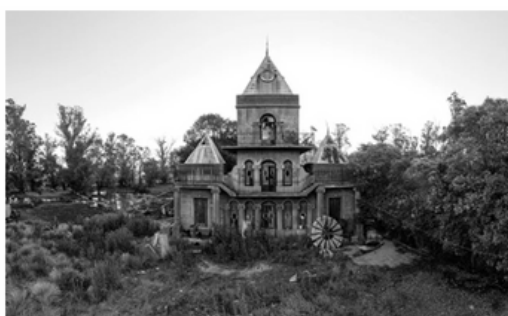
14 de Septiembre de 2022 a las 12:08